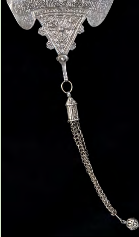
Parure pectorale ©Musée Pierre Bergé des arts berbères, Fondation Jardin Majorelle, Marrakech. Jarre, Maroc, 20 e siècle. Terre cuite. Fondation Jardin Majorelle, Marrakech, Maroc ©Fondation Jardin Majorelle, Marrakech /Mouad Fah.