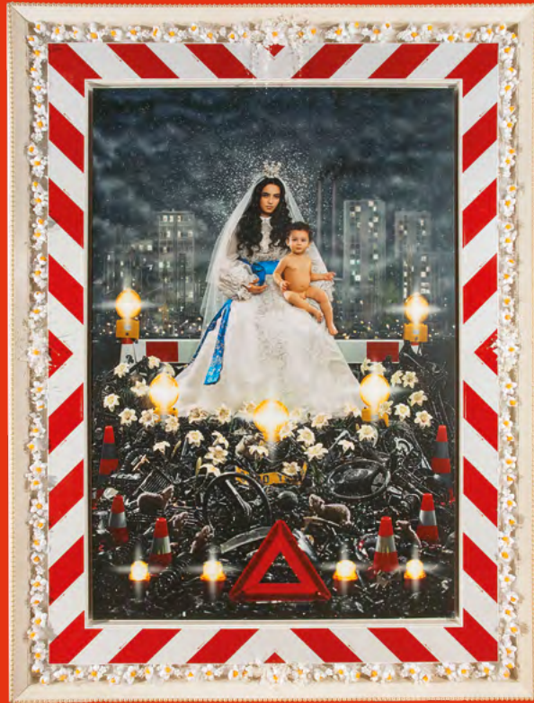
© Pierre et Gilles, La Vierge à l'enfant, Hafsia Herzi et Loric , 2009. Installation à l'église Saint-Eustache, dans le cadre de « La Force de l'art », Paris, avril 2009. Format avec cadre : 260,5 x 194,5 cm. Collection Pierre et Gilles.